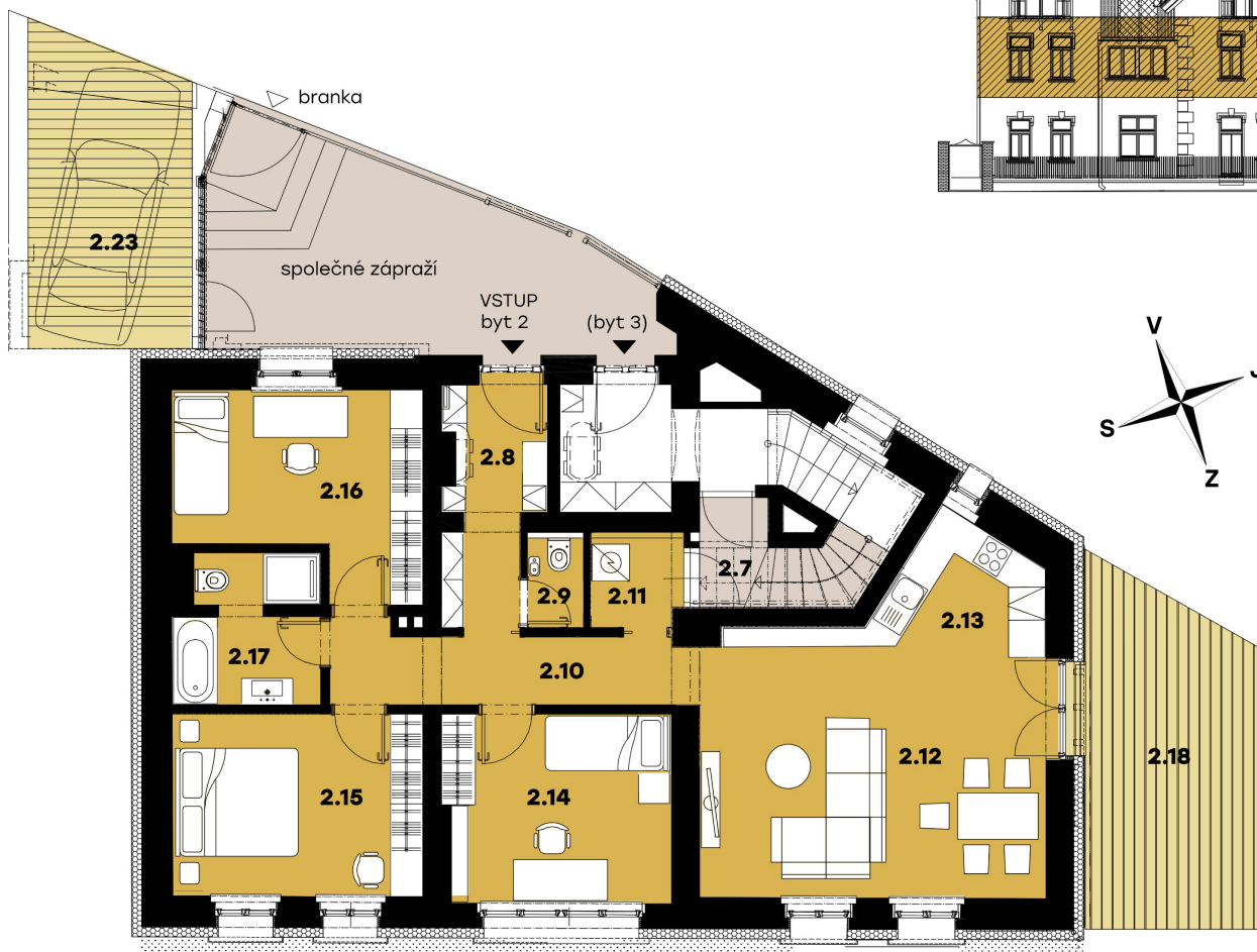
půdorys 2.NP - vstupní podlaží